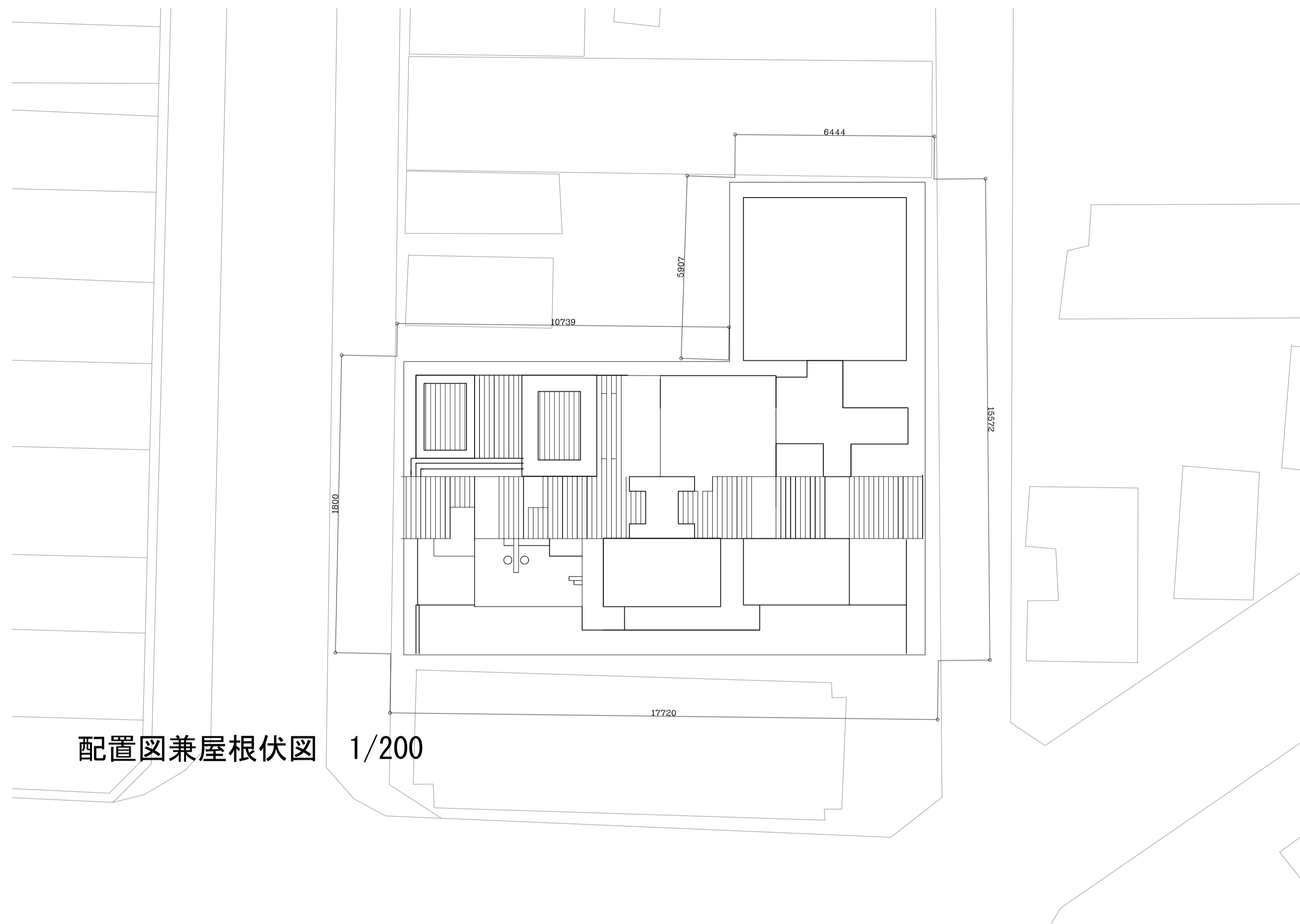
配置図兼屋根伏図 1/200