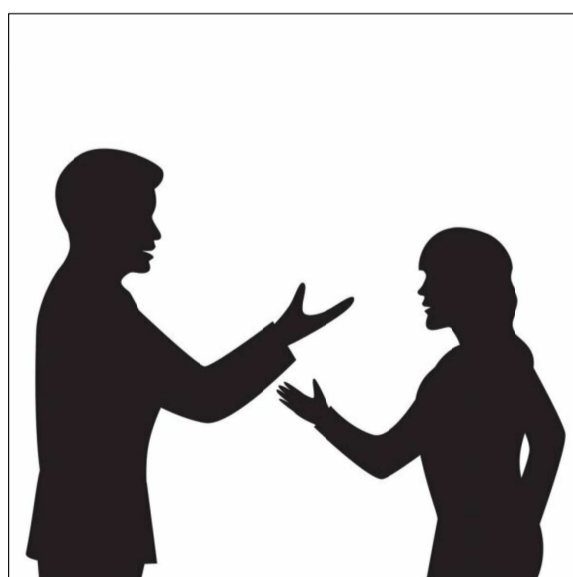
居住者 訪問者のコミュニケーション